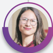
IRACÍ HASSLER Alcaldesa de Santiago